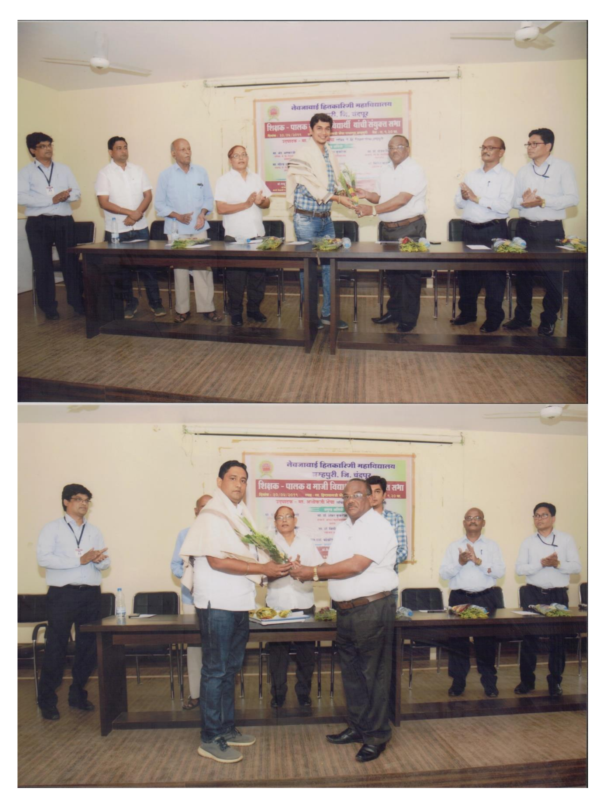
Session 2018-19 : Alumni, Parents & Teacher Meet