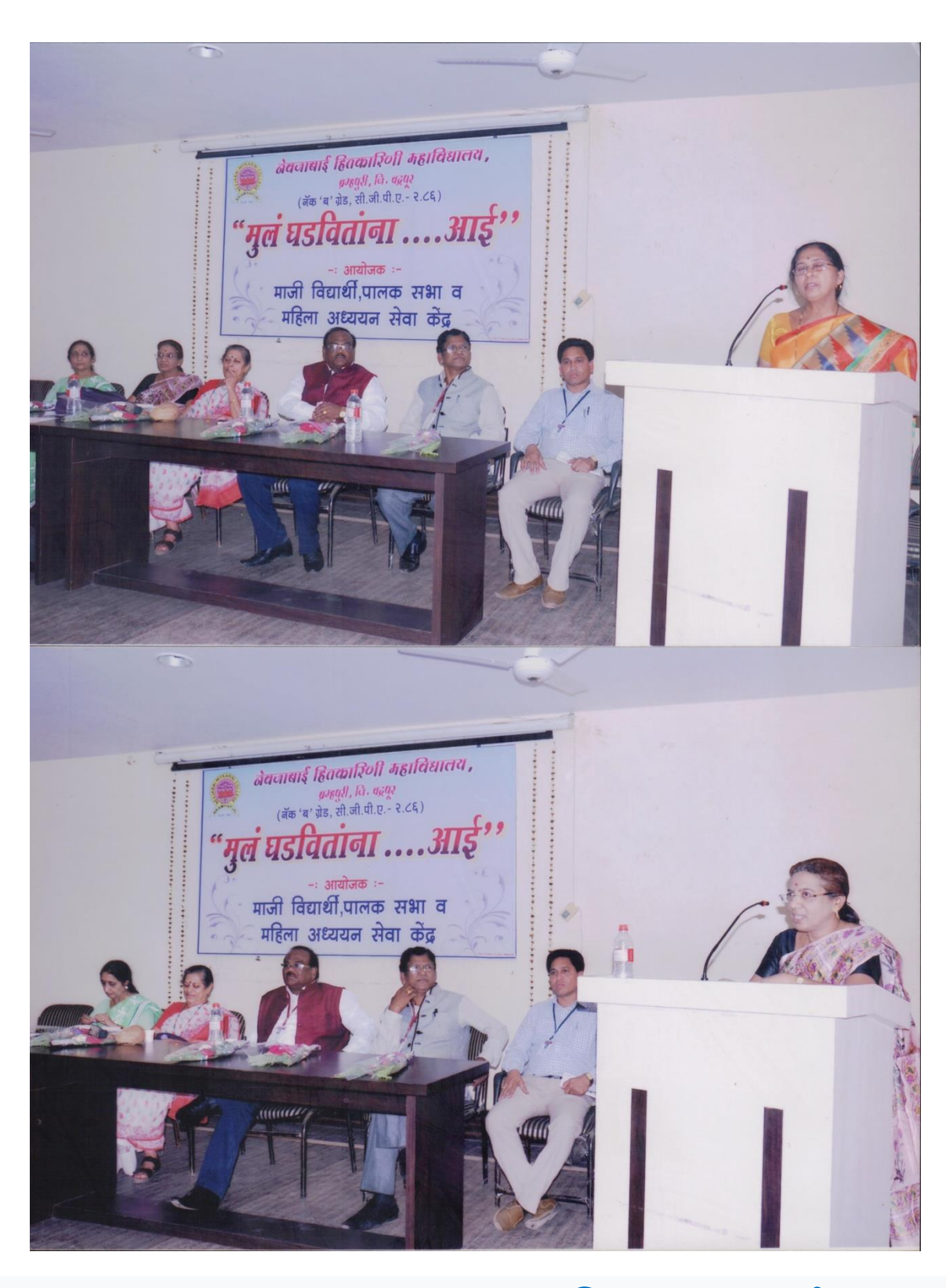
Session 2016 – 17 : Program (मुल घडाविताना. . . . आई) organized by Alumni, Parents & Teacher Association